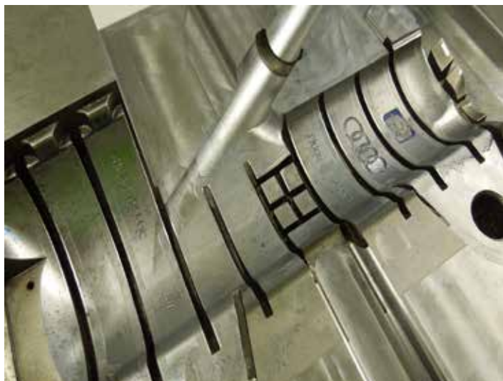
Forma vyrobená za použití elektroerozivního obrábění

a tedy progresivnější konstrukci. Každý model ale nemusí být ideální pro použití automatických funkcí, a proto je potřeba některé kroky nahradit manuálním zásahem konstruktéra. Zde je třeba dát velký pozor! Některý CAD software totiž předvádí tvorbu elektrod na jednoduchém dílu na tzv. jedno kliknutí. U modelů, u nichž není možné tyto automatické funkce použít, začíná být tento CAD neúčinný. Proto je