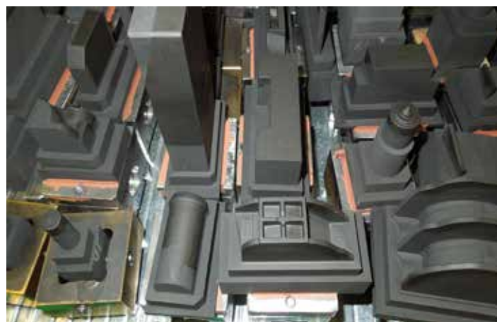
Obrobené grafitové elektrody

potřeba volit takový CAD software, který plně využívá automatizovaný