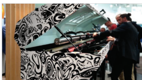
Světová premiéra podavače tyčí Ultra 80 na veletrhu EMO