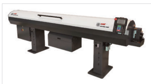
Na MSV Brno bude představen zbrusu nový podavač tyčí Alpha 342.

Společnost LNS představuje své produkty v Hannoveru pomocí virtuální reality, kterou si návštěvníci mohou pomoci inovativních brýlí pro rozšířenou realitu sami zkusit.